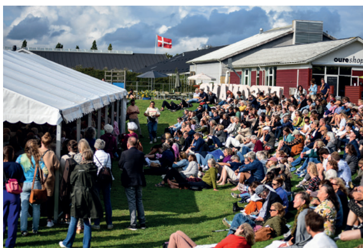
Svend Brinkmann og Mads Langer tiltrak mange både inde i teltet og udenfor, da de talte om "et liv i resonans". Der var desuden to andre hovedscener.